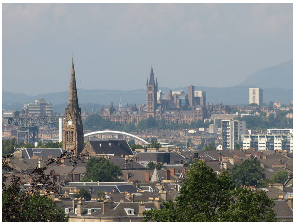
Glasgow - najväčšie mesto Škótska