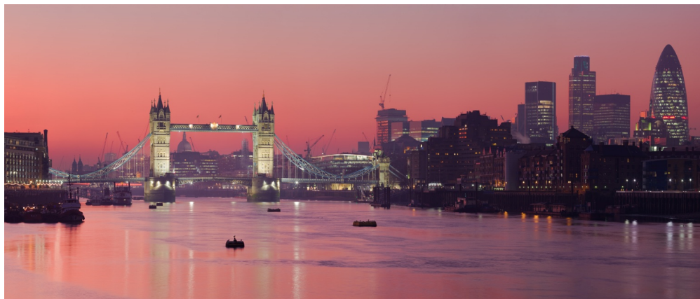
Londýn - hlavné mesto Spojeného kráľovstva